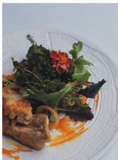
Najlepsza, regionalna kuchnia